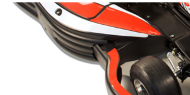
Pro-Slide Absorber system - Integral sliding protection Système d'absorption à coulisse «Pro-Slide System»