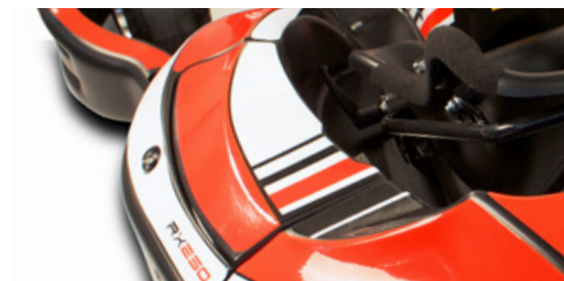
Weights box (standart equipment) Boite à plombs (équipement de série)