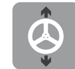
Adjustable steering wheel

Adjustable seat Siège réglable (patented system - système breveté)