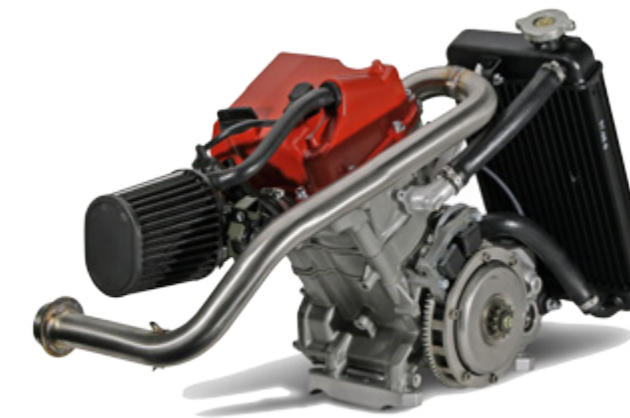
4 Strokes engine with power regulation Moteur 4 temps 250cc avec puissance modulable