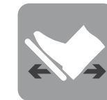
Adjustable pedal mechanism